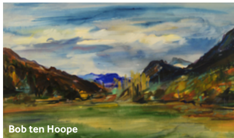
Bob ten Hoope

Des visites guidées du site et des expositions vous sont proposées chaque semaine, de même que la découverte du jardin, du verger et des alentours du couvent, lors d'événements spécifiques ou nationaux.